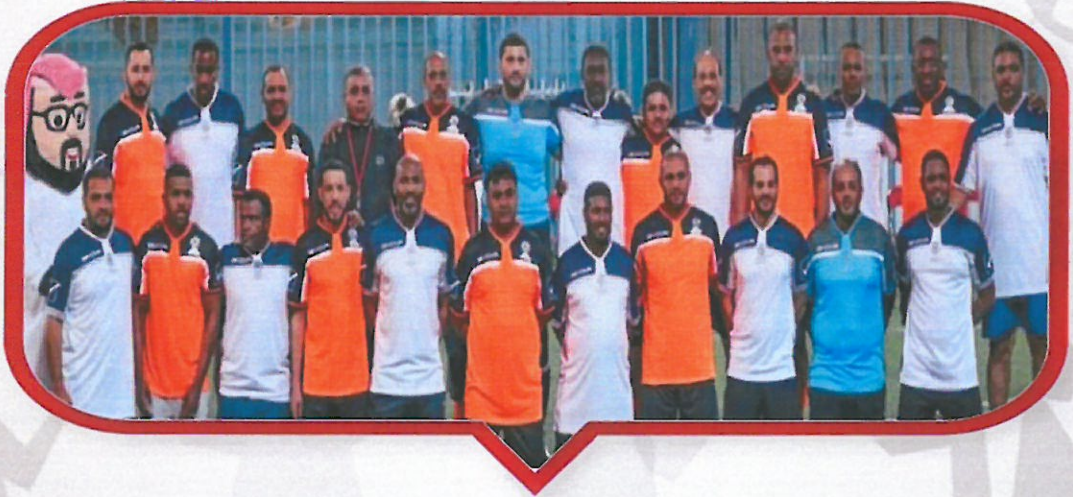
نخبة من نجوم الرياضة - اعضاء الجمعية